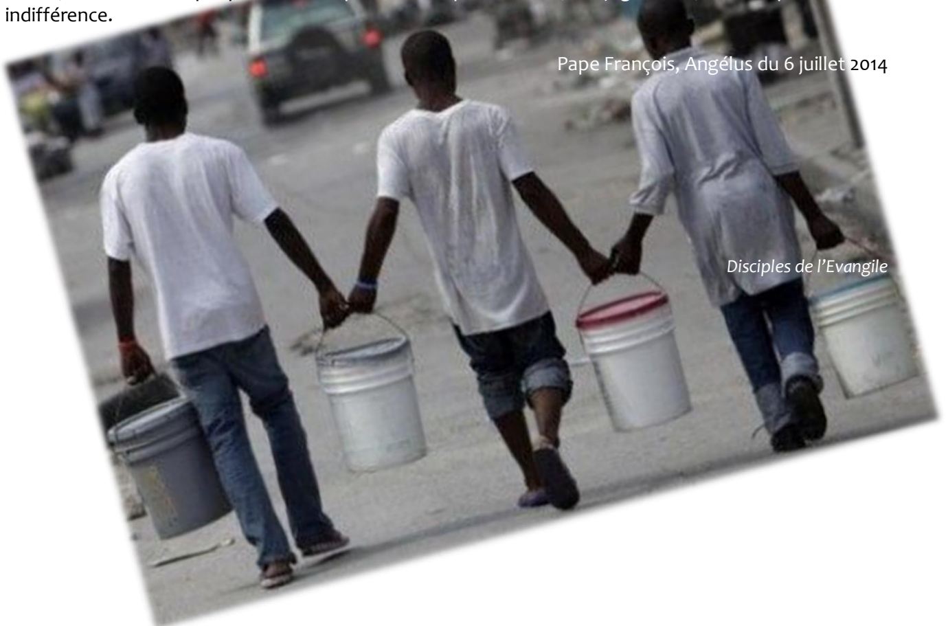
Disciples de l'Évangile

Pape François, Angélus du 6 juillet 2014